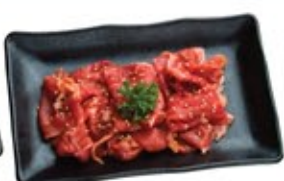
Bœuf Yaki-Shabu Tare* Yaki-Shabu Beef Tare Sweet Soy*