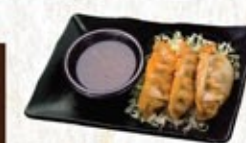
Raviolis Gyoza au porc 3 morceaux Pork Gyoza Dumplings 3 pcs

AJOUTS POUR +2$ CHAQUE! ADD-ONS FOR +$2 EACH!