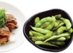
Takoyaki 3 morceaux Takoyaki 3 pcs