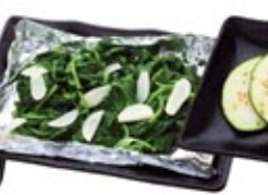
Épinards à l'ail Spinach Garlic