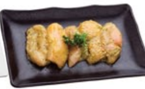
Cuisse de poulet basilic* Chicken Thigh Basil*