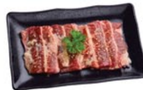
Collier Kalbi Tare* Kalbi Chuck Rib Tare Sweet Soy*

CHOISISSEZ 2 ou 3 ARTICLES DE BBQ CHOOSE 2 OR 3 BBQ ITEMS