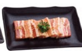
Flanc de porc Shio* Pork Belly Shio White Soy*