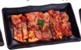
Porc épicé* Spicy Pork*