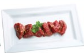
Filet Mignon Sel et Poivre* Filet Mignon Salt & Pepper*