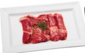
Bœuf coupe New York Miso* New York Steak Miso*