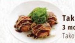
Takoyaki 3 morceaux Takoyaki 3 pcs