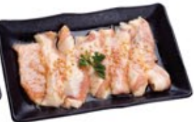
Porc Toro Shio* Pork Toro Shio White Soy*