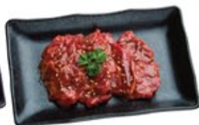
Onglet Bistro Miso* Bistro Hanger Steak Miso*