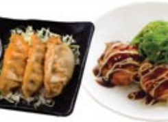
Raviolis Gyoza au porc 3 morceaux Pork Gyoza Dumplings 3 pcs