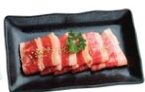
Bœuf Toro Tare* Toro Beef Tare Sweet Soy*