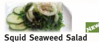
Squid Seaweed Salad イカ海藻サラダ $6