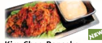
Kim-Chee Pancake w/ Spicy Mayo チヂミ $6