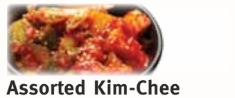
Assorted Kim-Chee キムチ $6