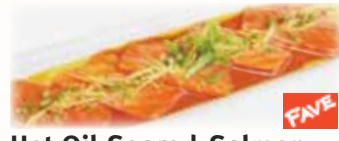
Hot Oil Seared Salmon in Citrus Sauce サーモンの刺身・牛角風 $10