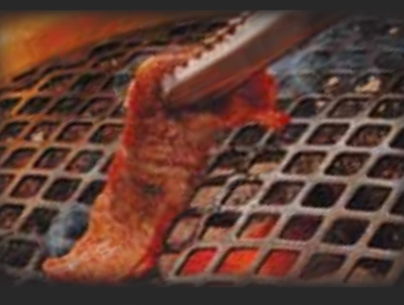
Kalbi Short Rib カルビ $11