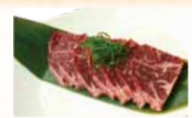
U.S. Kobe Bistro Harami 米国産神戸柔らかサガリ $18