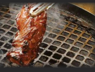
Harami Miso Skirt Steak ハラミ味噌 $10