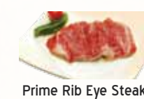
Prime Rib Eye Steak