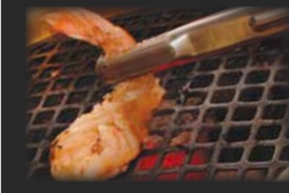
Shrimp Garlic 海老ガーリック $9