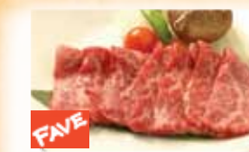
U.S. Kobe Kalbi Short Rib 米国産神戸カルビ $26