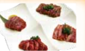
U.S. Kobe Sampler 米国産神戸盛り合わせ $40 4 cuts of selected U.S. kobe Beef