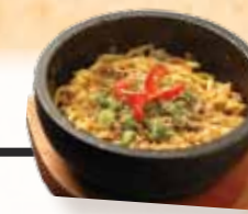
Chicken Garlic Noodles