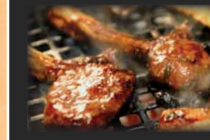
Lamb Chops ラム肉 $15