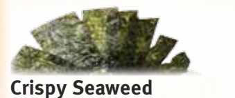
Crispy Seaweed 韓国のおり $2