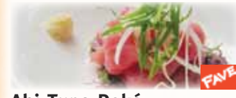
Ahi Tuna Poké アヒボケ $9