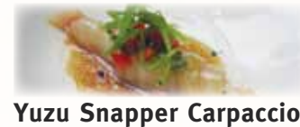
Yuzu Snapper Carpaccio 鯛のカルパッチョ $9