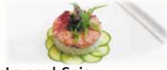
Layered Spicy Tuna Maki 手巻きツナ $8