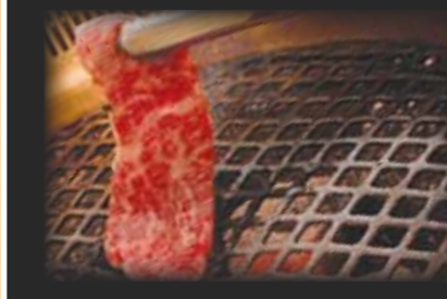
U.S. Kobe Kalbi Short Rib 特上カルビ $26