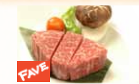
U.S. Kobe Filet Mignon 米国産神戸フィレミニオン $40