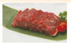
U.S. Kobe Chuck Flap 米国産神戸カイノミ $18