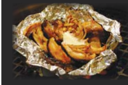
Mushroom Medley 三種きのこ $6