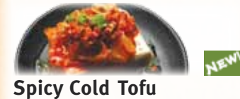
Spicy Cold Tofu 牛角特製 食べるラー油の冷奴 $5