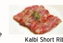
Kalbi Short Rib

Tare with house dipping sauce / Shio with lemon juice / Garlic with lemon juice