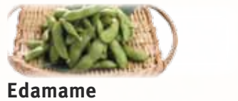
Edamame 枝豆 $4