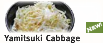
Yamitsuki Cabbage やみつぎキャベツ $4