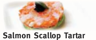
Salmon Scallop Tartar サーモン帆立タルタル $11