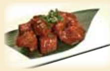
NAKAOCHI BEEF 中落ち