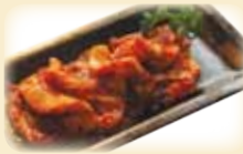
PORK BELLY 豚バラ