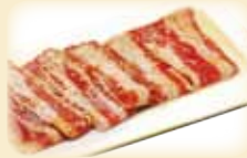
TORO BEEF トロビーフ