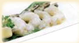
SHRIMP GARLIC 海老ガーリック