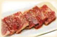
ROSU CHUCK FLAP ロース