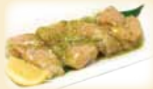
CHICKEN WHITE / THIGH チキン