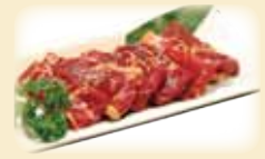
BBQ CHUCK KALBI バラカルビ