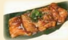
BEEF INTESTINE ホルモン