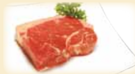
NEW YORK STEAK ニューヨークステーキ