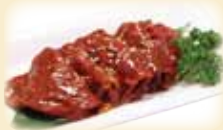
YAKISHABU MISO 焼きしゃぶ