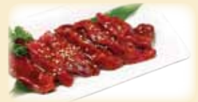
BISTRO HARAMI 柔らかサガリ