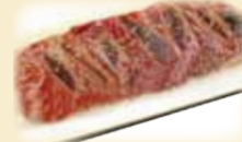
BONE-IN KALBI 骨付きカルビ