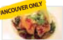
サーモン・ポケ Salmon Poké $6.95