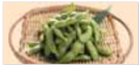
Edamame 枝豆 $3.50