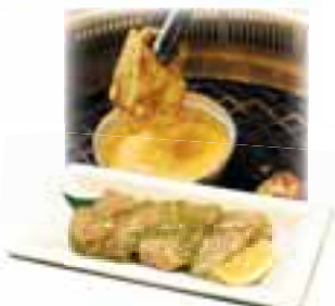
Chicken w/ Cheese Fondue

チキン・チーズフォンデュ $6.95 3.5oz Choice of white or thigh meat served with velveeta cheese fondue