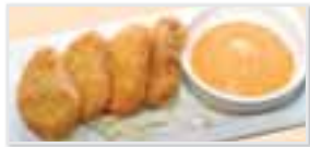
Tofu Nuggets 豆腐ナゲット $4.95