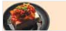
Spicy Cold Tofu スパイシー豆腐 $4.95