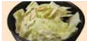
Shio Cabbage やみつき塩キャベツ $2.95