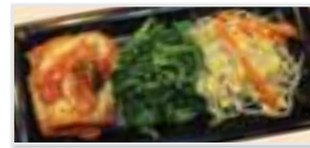
Namuru Set ナムルセット $3.95