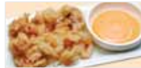
Fried Calamari イカのからあげ $5.95