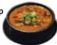
Spicy Kalbi Soup