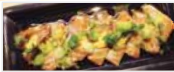
Oil Seared Salmon サーモンの刺身・牛角風 $6.95