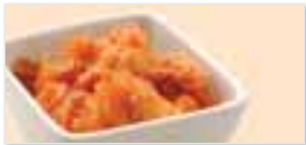
Kim-Chee 白菜キムチ $3.45