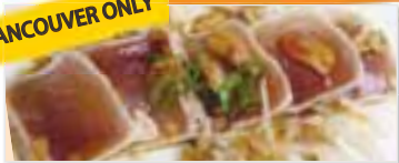
Tuna Tataki ツナたたき $6.95