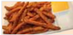
Sweet Potato Fries ポテトフライ (さつまいも) $3.95