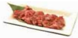
Harami Miso Skirt Steak