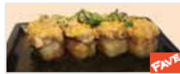
Spicy Tuna Volcano スパイシー・ツナボルケーノ $6.95