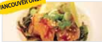
Salmon Poké サーモン・ポケ $6.95