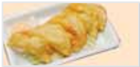
Fried Cheese Wonton チーズワンタン揚げ $3.95