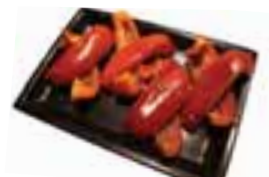
Red Bell Pepper