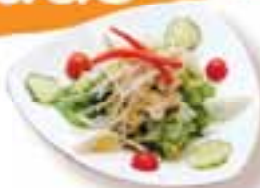
Gyu-Kaku Salad 牛角サラダ $7.95 full $4.95 half