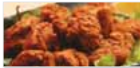
Chicken Karaage チキンからあげ $5.50